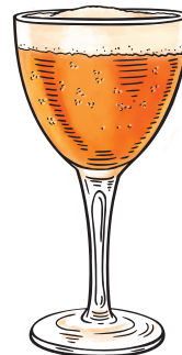
Shakerato Hoegaarden Campari | laranja | cenoura | Hoegaarden