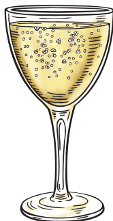
Limoncello Spritz Limoncello | Chardonnay gaseificado