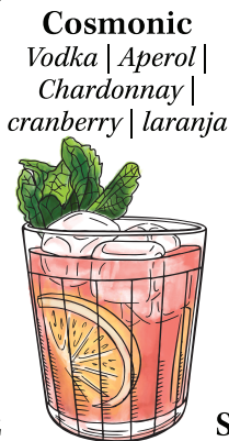
Cosmonic Vodka | Aperol | Chardonnay | cranberry | laranja