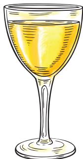
La Nostra Mimosa Prosecco | bitter | mix de laranjas Bahia e Pera